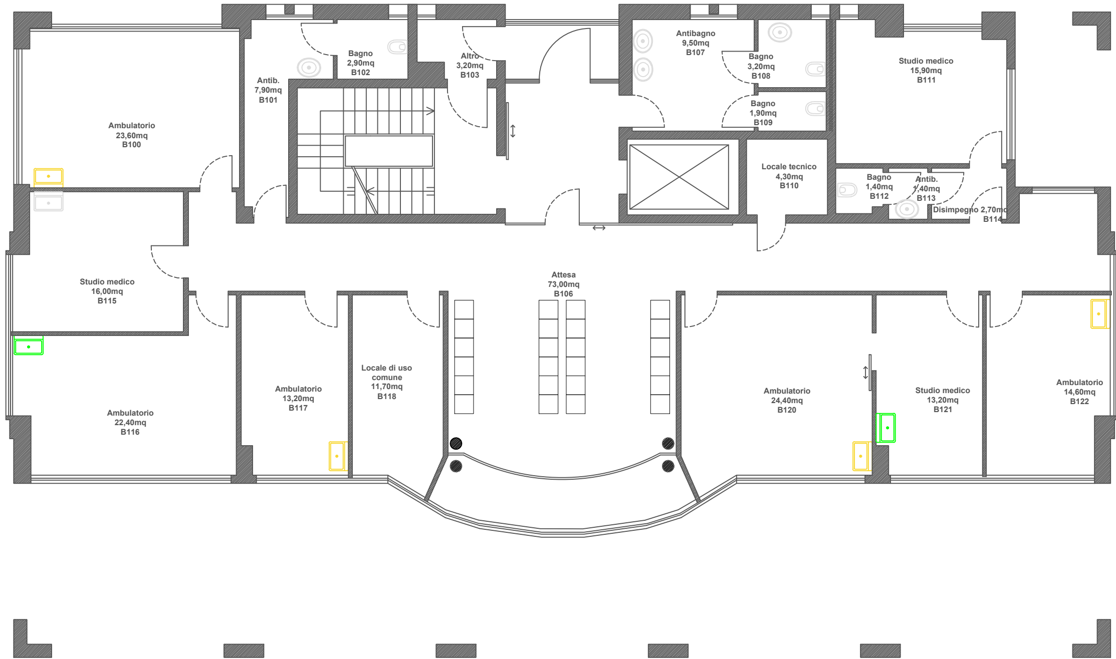
Stato di Progetto Pianta Livello B Scala 1:100